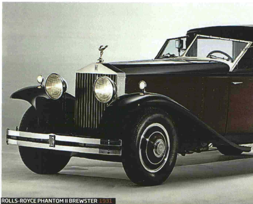
ROLLS-ROYCE PHANTOM II BREWSTER 1931