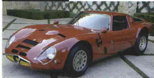
ALFA ROMEO TZ2 1963

A SINISTRA, L'ALFA ROMEO TZ2 COUPÉ ZAGATO (1965), PRODOTTA IN SOLI DIECI ESEMPLARI CHE SARÀ IN GARA AL CONCORSO DI VILLA D'ESTE SUL LAGO DI COMO. A DESTRA, LA PRIMA JAGUAR E TYPE (1961) ESPOSTA DA OGGI ALLA MOSTRA FUORISERIE DI ROMA