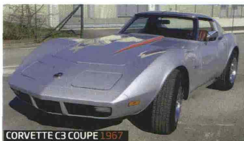
CORVETTE C3 COUPE 1967