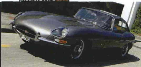
JAGUAR E TYPE 1961

A SINISTRA, L'ALFA ROMEO TZ2 COUPÉ ZAGATO (1965), PRODOTTA IN SOLI DIECI ESEMPLARI CHE SARÀ IN GARA AL CONCORSO DI VILLA D'ESTE SUL LAGO DI COMO. A DESTRA, LA PRIMA JAGUAR E TYPE (1961) ESPOSTA DA OGGI ALLA MOSTRA FUORISERIE DI ROMA