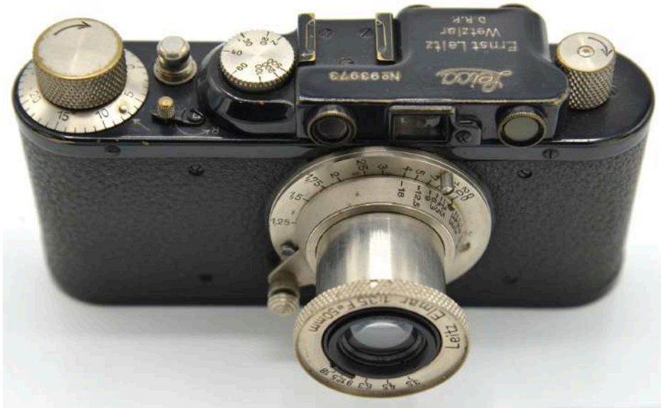
Museo Nicolis, Villafranca Verona, MF312 Leica II D del 1932

La mostra sarà visitabile fino all'8 febbraio 2026 e gode del supporto istituzionale del Ministero della Cultura , della Regione Emilia-Romagna e del Comune di Bologna , oltre alla stretta collaborazione con Adelphi Editore .