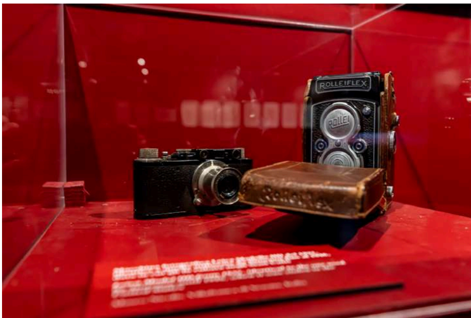
Museo Nicolis Leica II D del 1932, Mostra Simenon