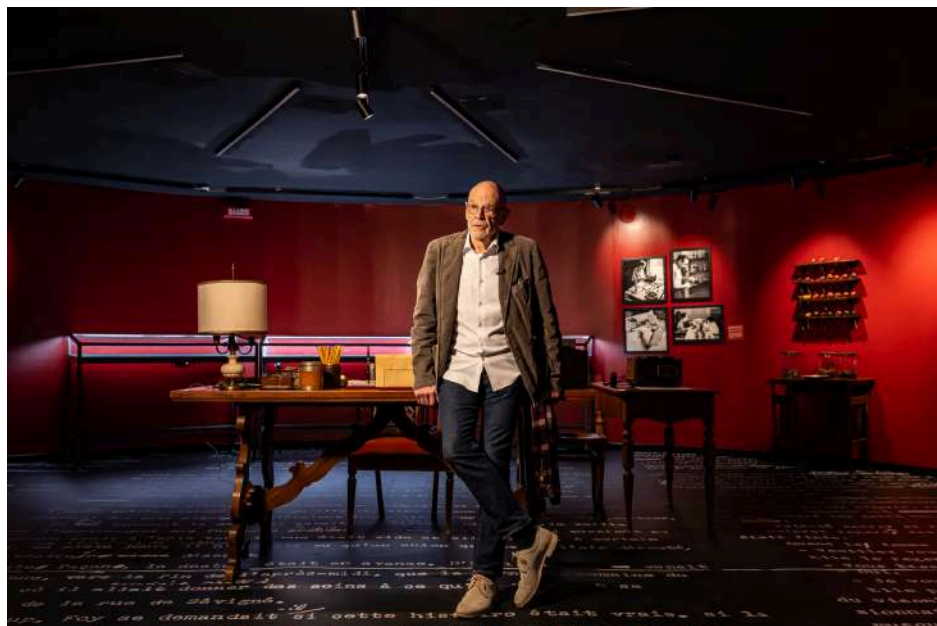
John Simenon

La Leica II (D) del museo rappresenta uno dei punti focali della mostra, essendo il modello con il quale il celebre scrittore ha scattato innumerevoli fotografie durante i suoi viaggi e reportage, testimoniando così il legame tra la sua arte letteraria e la passione per l'osservazione del mondo attraverso l'obiettivo. Si tratta di un autentico capolavoro che ha segnato un punto di svolta nella storia della fotografia, uno degli esemplari più pregiati tra le oltre 500 macchine fotografiche custodite nella prestigiosa sede di Villafranca di Verona.