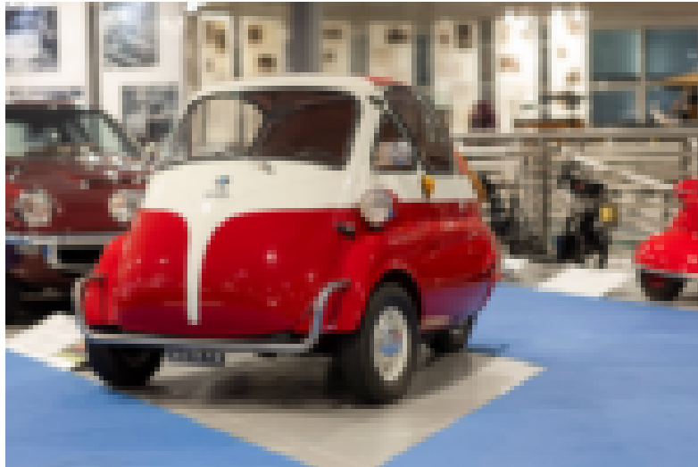
Museo Nicolis, Bmw Isetta