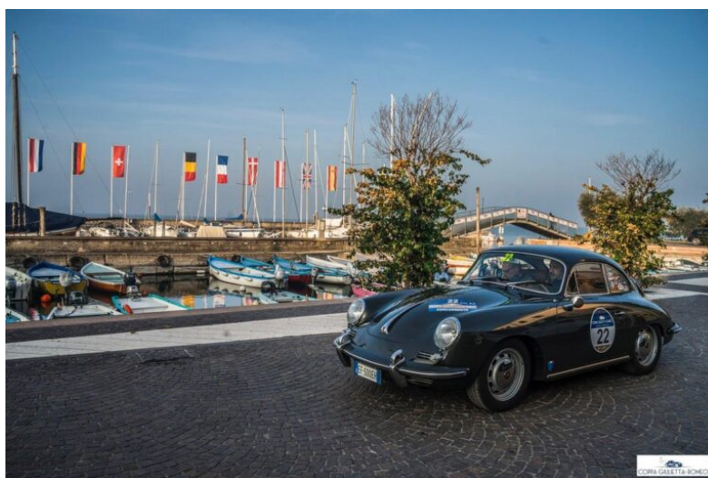
Coppa Giulietta & Romeo 2023