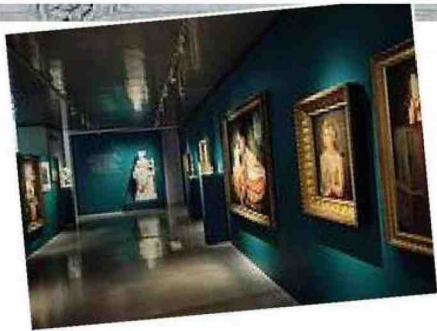
Compagnia La Scuola Grande di San Rocco, che contiene il maggior ciclo tintorettiano Nella foto piccola, la mostra di Canova a Possagno