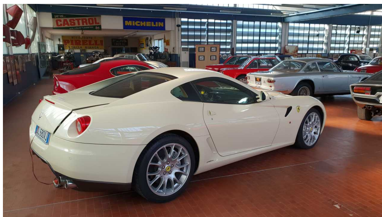
Museo Storico Alfa Romeo - Arese (MI)