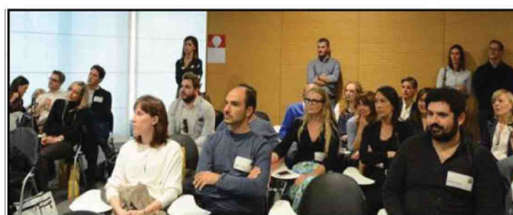
La cerimonia per la consegna dei diplomi al museo Nicolis